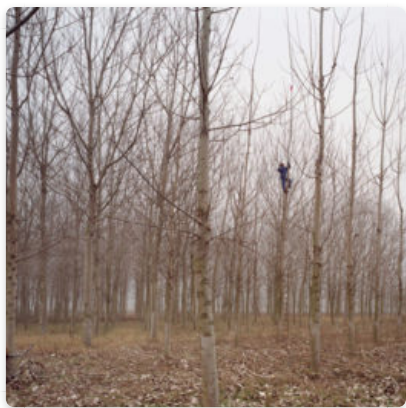
La contemporaneidad en cinco itinerarios