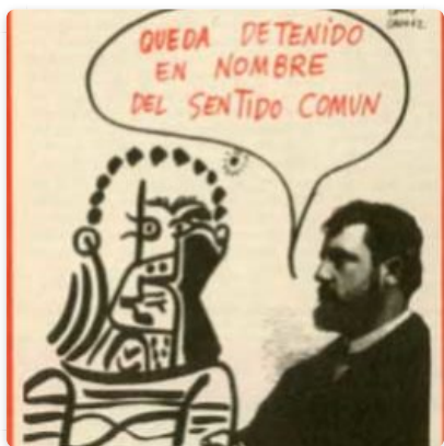
Humor absurdo: una constelación artística