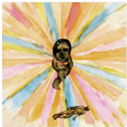
Nancy Spero y el arte como acto de rebelión