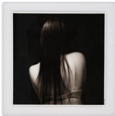
Nueve artistas transformarán el programa One Project de ART MADRID